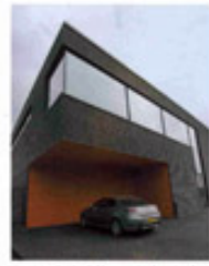
Deze is gebouwd als hopenverhaal in het ontwerp van de gissenverhaal van de verpakt in de oververstent.

Harde overgangen De woning is vrijwel linear geventigend alle vertrekken liggen in een verticaal vlak achter een hopen vlak. Het begint bij de garage aan de Noord Wiergroot, via een gissen trapgevoel naar een patio daartussen,